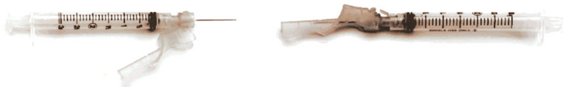
Figura 3. Aguja con protección tipo bisagra